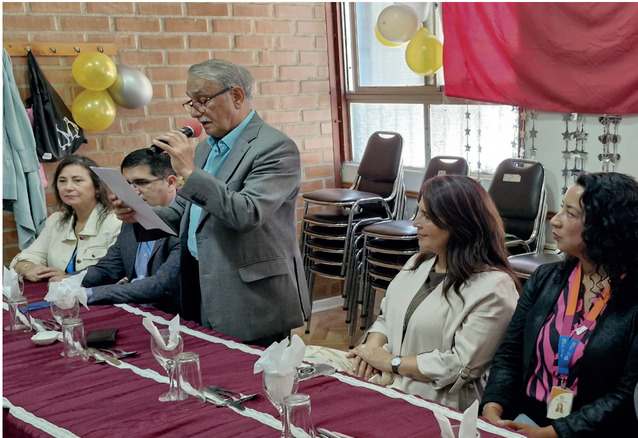
EL PRESIDENTE DE LA CENTRAL UNITARIA DE JUBILADOS, PENSIONADOS Y MONTEPIADAS DE CHILE, C.G. CUPEMCHI ENTREGA SU SALUDO EN EL DÍA DE LA MUJER.

nas, Sociedad Mutualista Portuarios de Chile Filial Valparaíso, Sociedad Profesionales Portuarios de Chile Valparaíso, Sociedad de Portuarios Jubilados Mariano Valenzuela, Departamento de Profesores Jubilados DEPROJ, Corporación Mutualista de Tripulantes Jubilados CORMUTRIJUCH, Sociedad Portuarios Jubilados y Montepiadas SOPORJUM, Sociedad Imprenta y Obras, Asociación de Pensionados ANACPEN, Asociación de Pensionados Universidad de Chile, APEUCH.