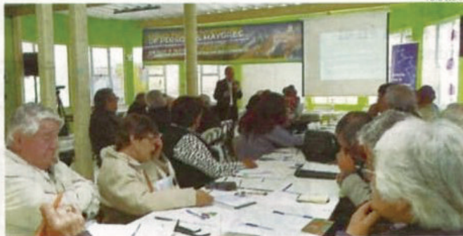
LAS PERSONAS MAYORES PLANTEARON SUS NECESIDADES EN EL ENCUENTRO REGIONAL.

actividades paralelas en San Antonio jugaron en contra para la convocatoria.