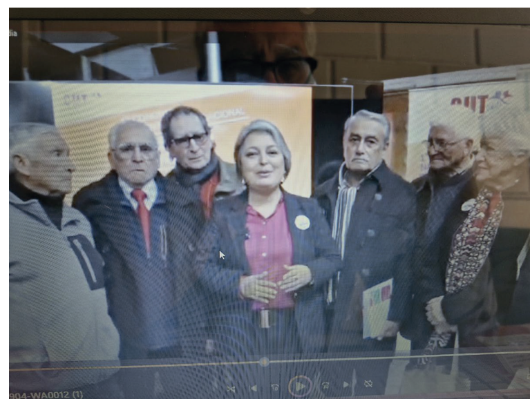
Un video se exhibió de las actividades realizadas por los dirigentes de Cupemchi Nacional, donde se incluyó un saludo de la Ministra del Trabajo y Prevision Social. Jeanette Jara Román.