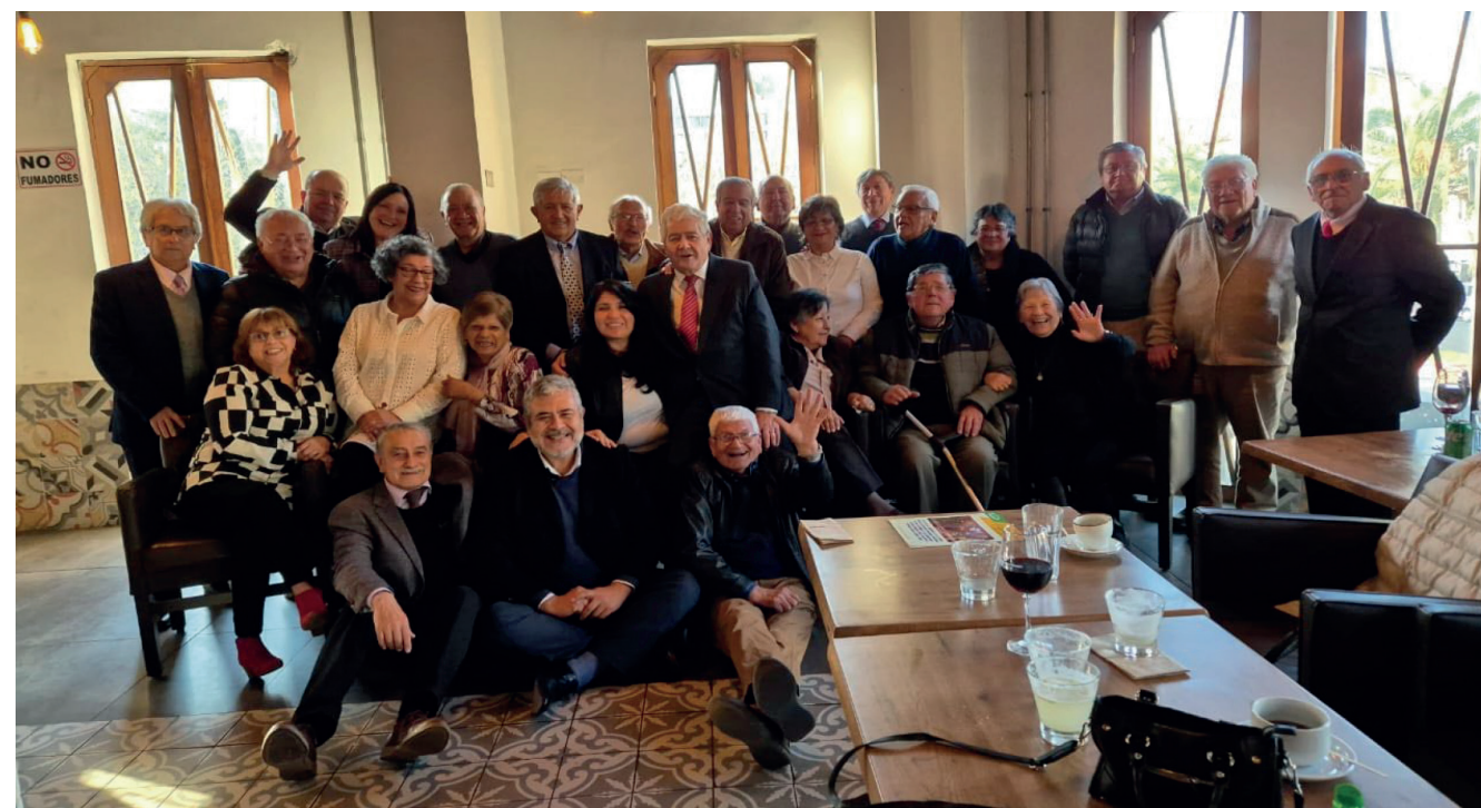
En la foto: Autoridades, Invitados y Dirigentes Nacionales y Regionales de Cupemchi, quienes celebraron el Aniversario 33, con muchas congratulaciones y deseo de presente y futuro para esta Organización Mayor, de la cual, las Personas Mayores desean las representen activamente en sus demandas sociales.